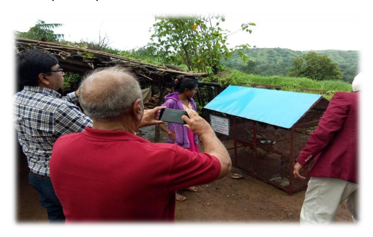
Visit to village Project Office for Records Verification